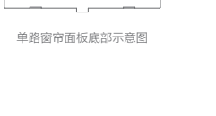
单路窗帘面板底部示意图